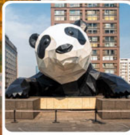
หมีแพนด้ายักษ์ป็นตึก