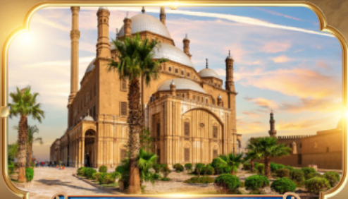
สุเหร่าแห่งโมฮัมหมัดอาลี