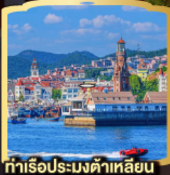
ท่าเรือประมงต้าเหลียน