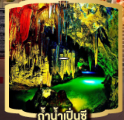
ถ้ำน้ำเป่ย์ซี