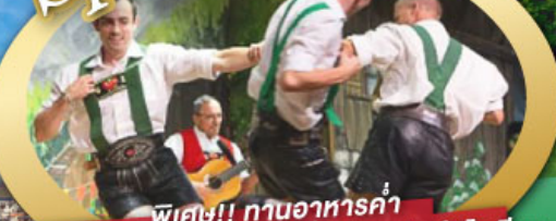
พิเศษ!! ทานอาหารค่ำ พร้อมชมการแสดงดนตรีพื้นเมืองสไตส์ทีโรเลียน และเยือนเมืองอูเทรคต์ สีสันใหม่เนเธอร์แลนด์

ไฮไลท์โปรแกรม • เยือนเมืองแห่งแคว้นบาวาเรีย และ ทิโรล • สุกสนานเหมืองเกลือเบิร์ชเทสกาเดิน • เข้าชมปราสาทนอยชวานสไตน์ • เดินเล่นจัตุรัสโรเมอร์ ซอปปิง Zeil Street • ถ่ายรูปมุมสวยของหมู่บ้านอัลสติก • ซิลลา ไปในเมืองซาลสบูร์ก บ้านเกิดโมสาร์ท • ล่องเรือหมู่บ้านทีธูร์น และ ล่องเรือชมนครอัมสเตอร์ดัม • ซอปปิงจุ้ย่านดิมสแควร์และเดินเล่นย่านโคมแดง 25 ก.ย. - 04 ต.ค. 69 09-18, 16-25 ต.ค. 69 22-31 ต.ค. 69 / 06-15 พ.ย. 69 29 ธ.ค. 69 - 07 ม.ค. 70 * ปีใหม่ *