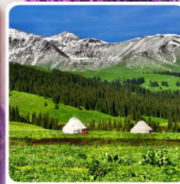
ทุ่งหญ้านาลาตี