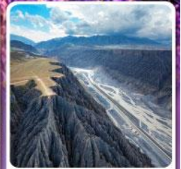
แกรนด์แคนยอนคู่ชานจื่อ