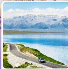
ทะเลสาบไซไห่หลี่มู่