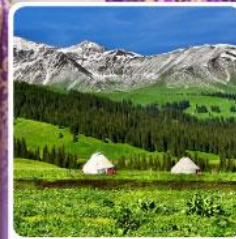
ทุ่งหญ้านาลาติ