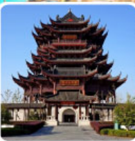
วัดหลงหยวน