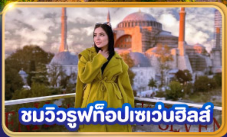
ชมวิวยูฟิโอปเซเวนฮิลส์