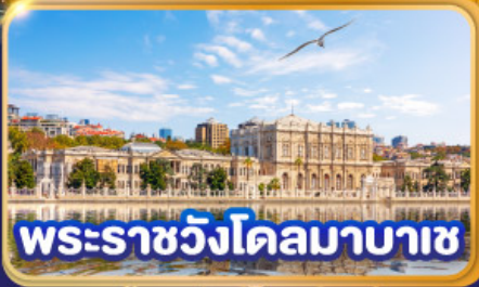
พระราชวังโดลมาบาซ