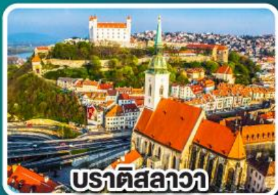
ปราตีสลาวา