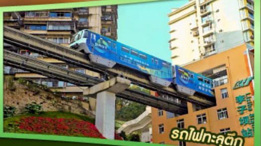
รถไฟฟ้าลัดคิว