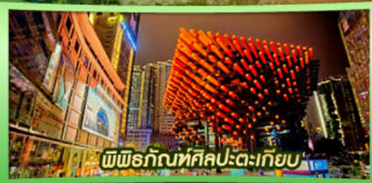
พิพิธภัณฑ์ศิลปะตะเกียบ