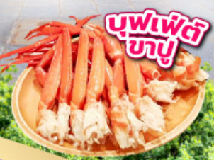
บุฟเฟ่ต์ 3 อย่าง