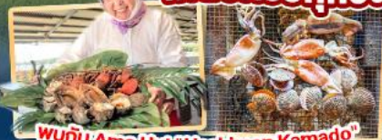
พบกับ Ama Hut "Haohiman Kamado" เมนูพิเศษ SEA FOOD

สายการบิน AirAsia X (XJ) น้ำหนักกระเป๋า 20 KG