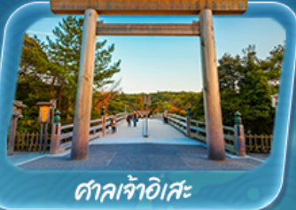
ศาลเจ้าอิสะ

12 - 17 พ.ค. 69 / 19 - 24 พ.ค. 69 26 - 31 พ.ค. 69 / 2 - 7 มิ.ย. 69 9 - 14 มิ.ย. 69