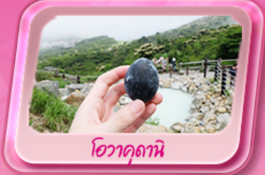
โอะวาคุดานิ

พรมสีชมพูผืนใหญ่ที่ฐานฟูจิซัง! เทศกาลชิบะซากุระ: 1 ปีมีครั้งเดียว เปิดประสบการณ์ล่องเรือโจรสลัด ตะลุยหุบเขาโอะวาคุดานิ ซิมโซ่คำ "Unseen" ของพรด้วยหัวโซเทเกะ ที่วัดมิตสึงิยาม่า โซเค็น ช้อปปิ้งจัดเต็มย่านคิงชินจูกุ และ Gotemba Outlet