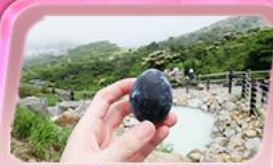
โอะวาคุดานิ

ชมสีชมพูผืนใหญ่ที่ฐานฟูจิซัง! เทศกาลซิบะซากุระ: 1 ปีมีครั้งเดียว เปิดประสบการณ์ล่องเรือโจรสลัด ตะลุยหุบเขาโอะวาคุดานิ ซิมโง่คำ "Unseen" ชมพรต้วยหัวโซเทเกะ ที่วัดมิตสึซึยาม่า โซเด็น ช้อปปิ้งจัดเต็มย่านคังชินจูกุ และ Gotemba Outlet