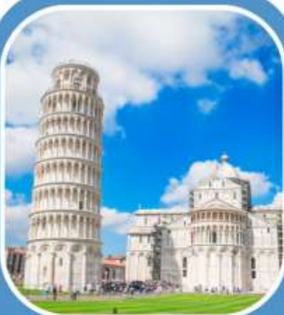
อิตาลี 3 คืน

โรม•นครรัฐวาติกัน•มหาวิหารเซ็นต์ปีเตอร์•โคลอสเซียม•น้ำพุเทรวี่•บันโดสเปเนมอนเตคาตินี•ปีซ่า•หอเอนเมืองปีซ่า•ล่องเรือเกาะเวนิส•ชมเมืองมิลาน อินเทอร์ลาเคน•เลาเทอร์บรุนเนน•พีชียอดเขาจุงเฟรา•ชมเมืองลูเซิร์น•ตจอง•ปารีส เข้าชมพระราชวังแวร์ซายย์ล่องเรือชมแม่น้ำแซนน์•ช้อปปิ้งสินค้าแบรนด์เนม•มองมาร์ต