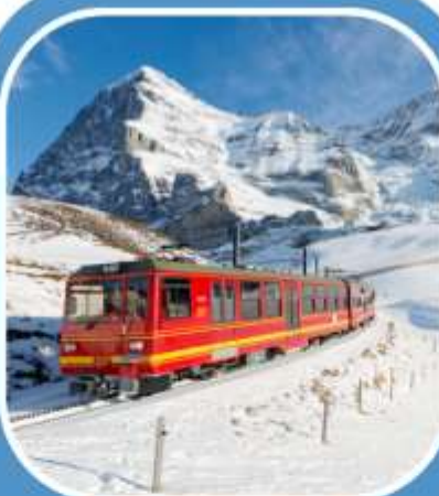
สวิสฯ 2 คืน