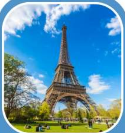
ฝรั่งเศส 2 คืน