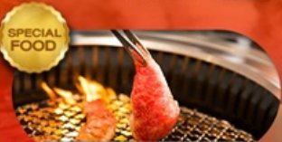
อาหารมือพิเศษ ปิ้งย่างยากิniku