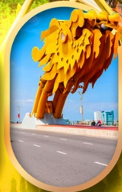
สะพานมังกรดานัง