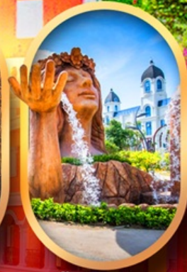
น้ำตกเทพพิสดวง