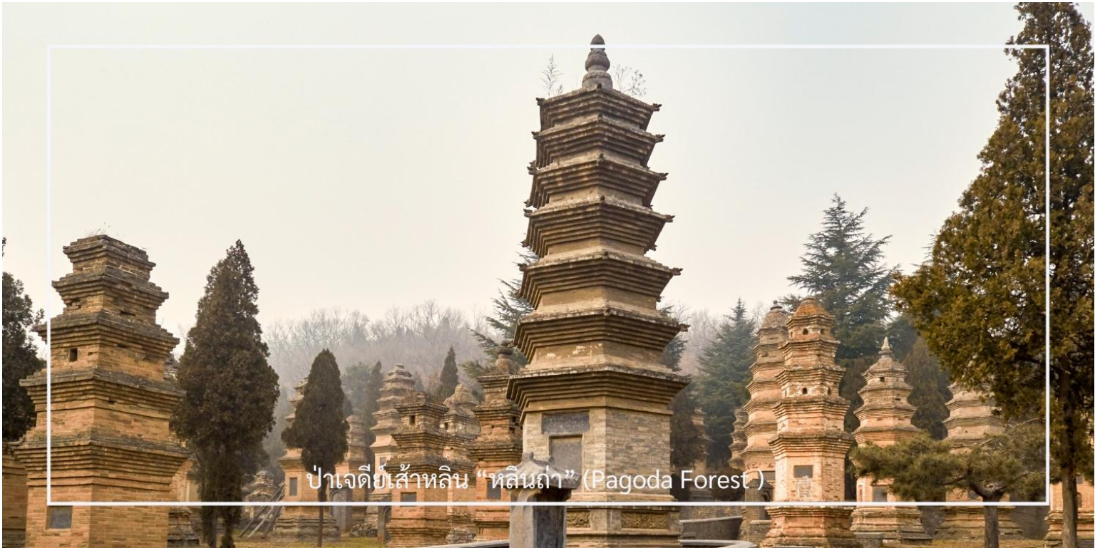
ป่าเจดีย์สี่เหลี่ยม “หลินถา” (Pagoda Forest)

ภายในบริเวณเต็มไปด้วยเจดีย์หินจำนวนมากกว่า 240 องค์ ซึ่งบางองค์มีความสูงถึง 15 เมตร เจดีย์แต่ละองค์มีขนาดและรูปร่างแตกต่างกันไปตามยุคสมัย เช่น ทรงกลม ทรงสี่เหลี่ยม และทรงหกเหลี่ยม อีกทั้งยังประดับด้วยลวดลายแกะสลักอย่างวิจิตรงดงาม บางองค์มีจารึกที่บอกเล่าชีวประวัติของพระภิกษุผู้ได้รับการบูชาขึ้น ๆ