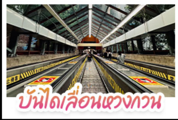
บันไดเลื่อนแขวงทวน