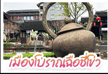
เมืองโบราณฉือชี่เซว