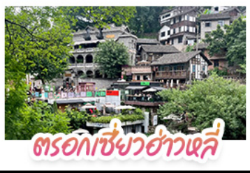
ตรอกเซี่ยวฮ่าวเสี