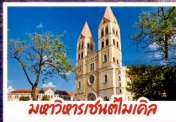
มหาวิหารเซนต์โมติล