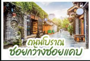
ถนนโบราณ ชอยกวางชอยแคบ