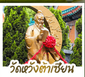
วัดเว่งต่าเซียง