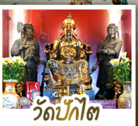
วัดป้กั๊ต