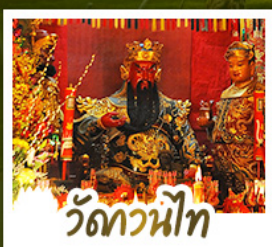
วัดกวนหน้้ท