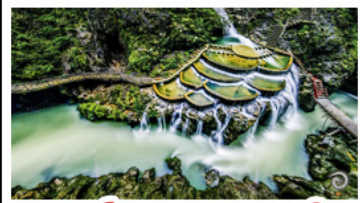
แกรนด์แคนยอนหลงเหิน

เขาฟ้าหิม - เมืองโบราณผู่แรงเงิน เมืองโบราณเฟิ่งหวง - เกาะสัมจิวโจ้ว แกรนด์แคนยอนหลงเหิน - ไม่เข้าร้านซ้อป พักโรงแรม 5 ดาว - รถไฟความเร็วสูง