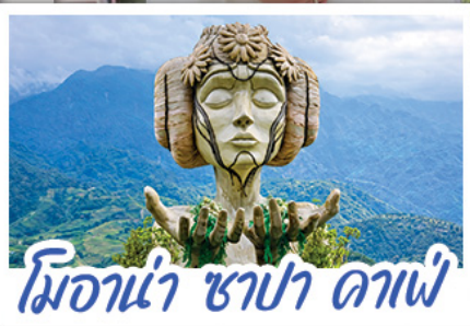
มิอาน่า ซาปา ดาฟี่