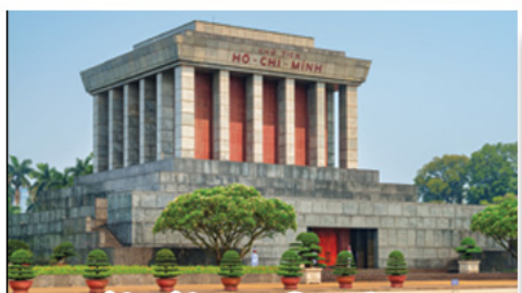
จัตุรัสบาติงห์