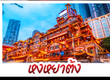
แดนเฉิงชิ่ง