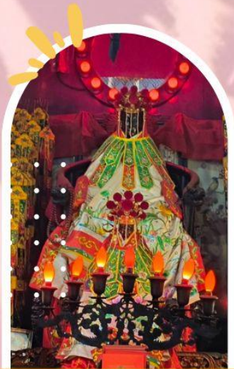
วัดเจ้าแม่กวนอิมฮ่องกง ขอพรเรื่องเงิน ทรัพย์สิน และความมั่งคั่ง