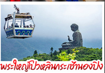
พระใหญ่ไผ่หลินและกระเช้าเองปีง

2UHKG-TG005 | 4 วัน 3 คืน | THAI | อีปเกรดกระเช้าเองปีง 1 เกี้ยว Crystal Cabin | ย่านจิมซาจุ่ยหรือย่านมงก๊ก | โรงแรม 4 ดาว