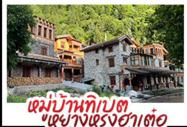
หมู่บ้านทิเบต เข้างตรงฮาต้อ