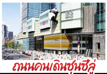
ถนนคนเดินซุนซู่