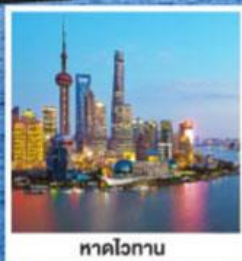
หาดไว่กาน