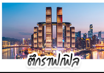
ตึกรางฟิฟล์