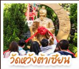
วัดเซ่งต้าเซียง