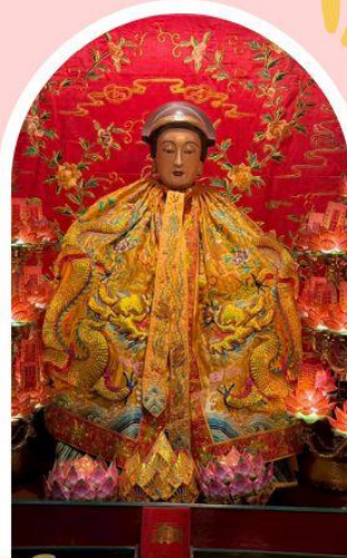
วัดหล่งโหมว

ความสำเร็จ ความมั่งคั่ง เงินทองไหลมาเทมา