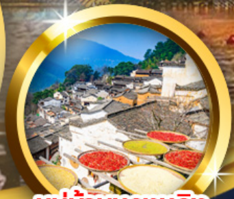
กระบอกแห่งท้องฟ้า