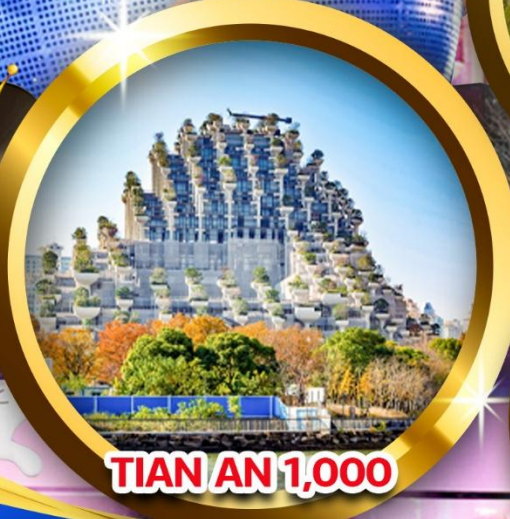
TIAN AN 1,000