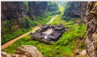
อุทยานหลุมฟ้าสะพานสวรรค์