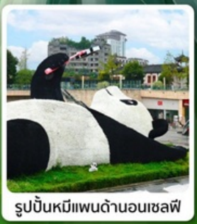
รูปปั้นหมีแพนด้าบนเซฟิ