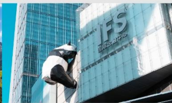
แพนด้ายักษ์ปีนตึก IFS