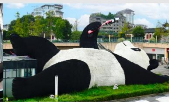
รูปปั้นหมีแพนด้าอนเซลฟี่