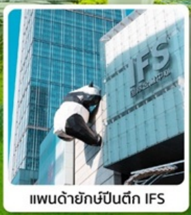
แพนด้ายักษ์ปีนตึก IFS