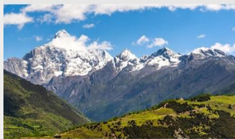
ภูเขาสี่ดรุณี (หุบเขาชวงเจียวโกว)