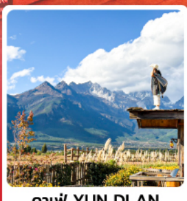
คาเฟ่ YUN DI AN