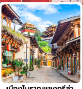
เมืองโบราณแซงกรีล่า