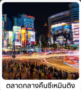
ตลาดกลางคืนซีเหมินติง