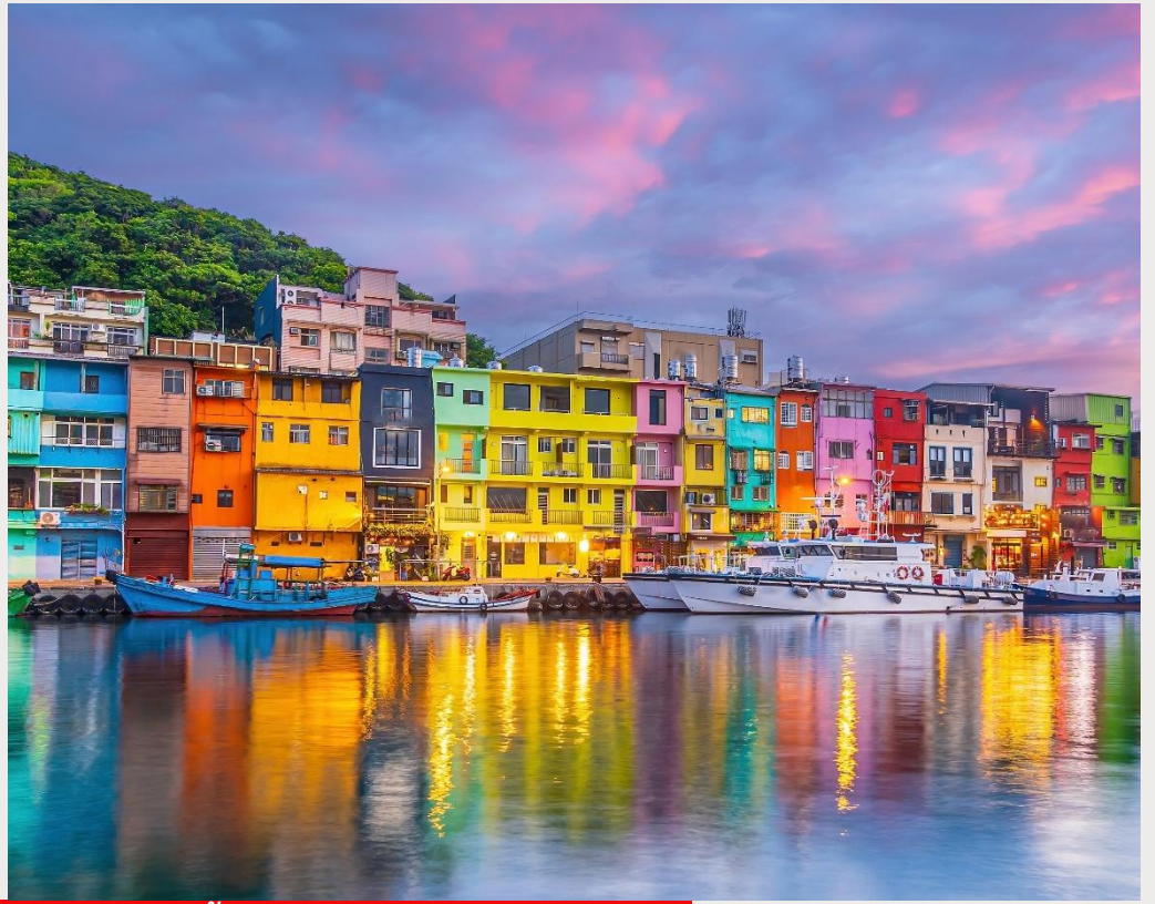
ท่าเรือประมงเจิ้งปิน (Zhengbin Fishing Port)

จากนั้นนำท่านเดินทางสู่ ถนนโบราณจิ่วเฟิ่น (Jiufen Old Street) ตั้งอยู่บนเขา ทิวทัศน์ภาพสวยงาม ด้านหลังเป็นภูเขา ด้านหน้าเป็นวิวทะเลสีทอง แต่เดิมเคยเป็นหมู่บ้านเล็กๆ ที่โอบล้อมด้วยทิวเขา และมองเห็นท้องทะเลอยู่ลิบๆ หมู่บ้านแห่งนี้อดีตเคยเป็นเมืองทองคำที่มีชื่อเสียงตั้งแต่สมัยกษัตริย์กวางสวี่ แห่งราชวงศ์ชิง โดยตั้งแต่ช่วงปี ค.ศ. 1890 ได้มีการสำรวจพบแร่ทองคำ ญี่ปุ่นที่เป็นผู้ครอบครองได้หวั่นขณะนั้น ได้เนรมิตให้ที่นี่เป็นเมืองทอง โดยใช้แรงงานหลักคือเชลยศึก ซึ่งนำมาซึ่งความมั่งคั่งและคึกคักให้กับเมือง แต่เมื่อแร่ทองคำร่อยหรอ จนบริษัทเอกชนของไต้หวันที่มารับช่วงต่อในช่วงปี ค.ศ. 1987 ต้องประสบภาวะขาดทุนจนต้องปิดกิจการไปในที่สุด จนเป็นแรงบันดาลใจให้ผู้สร้างของญี่ปุ่นอย่างสตูดิโอจิบลิ ได้ใช้เป็นฉากหลังของหนังการ์ตูนที่โด่งดังจนคว่ำรางวัลออสการ์มาครองในปี 2002 กับเรื่อง “SPIRIT AWAY” นอกจากนี้ภายในหมู่บ้านที่เต็มไปด้วยอาคารโบราณย้อนยุคอันเป็นเสน่ห์หลักของเมืองนี้ ทั้งสองข้างทาง มีสินค้าน่าชายนอยู่มากมาย ไม่ว่าจะเป็น ของที่ระลึก อาหารท้องถิ่น ชุดเสื้อผ้าที่เพ้า ร้านอาหาร เป็นต้น (โดยสารรถประจำทางขึ้นไป)