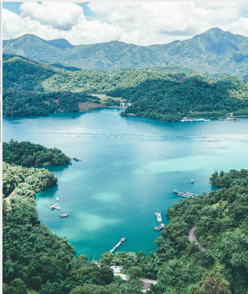
ล่องเรือทะเลสาบสุริยันจันทรา (Sun Moon Lake)

นำท่านเดินทางสู่ วัดพระถังซำจั๋ง (Xuanguang Temple) นมัสการพระอัฐิของพระพุทธเจ้าที่อันเชิญมาจากชมพูทวีป เป็นอีกวัดหนึ่งที่ต้องมาเยือนหากได้มาที่ทะเลสาบสุริยันจันทรา วัดนี้มีรูปปั้นพระถังซำจั๋งให้นมัสการ อีกทั้งมีวิวทะเลสาบที่สวยงาม และพิพิธภัณฑที่จัดแสดงประวัติของพระถังซำจั๋ง ภายในวัดมีบรรยากาศที่สวยงาม เงียบสงบ