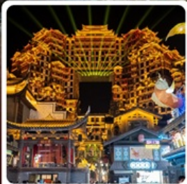
ตีทมหัตจรรย 72