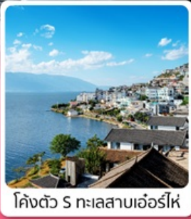
โค้งตัว S ทะเลสาบเอ๋อร์ไห่