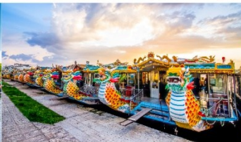
ล่องเรือมังกร