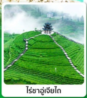
ไร่ชาอู๋เจียโต