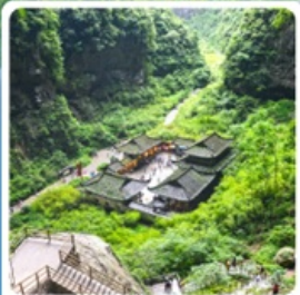
อุทยานแห่งชาติหลุมฟ้า

อาหารมื้อพิเศษ เปิดปิกกิ้ง, สุกี้หม่าล่า