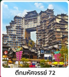
ตึกหอคจรรย 72