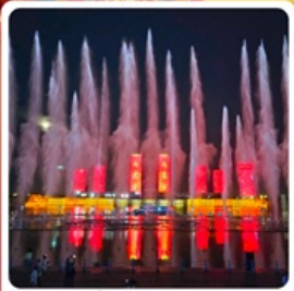
น้ำพุคังปายี

● โอโหล้ เป็นทรายเสียงชาวนา แหล่งท่องเที่ยวระดับ 5A ของจีน ภูเขาไฟอุลันฮาตา น้ำพุคังปายี น้ำพุที่สูงที่สุดในเอเชีย