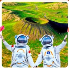
อุทยานภูเขาไฟอุลันฮาตา