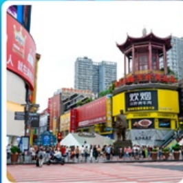
ถนนหวงซิงลู่