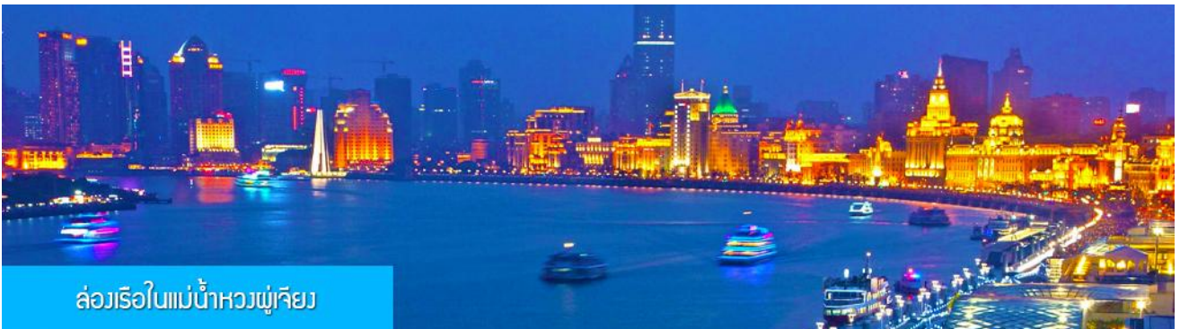
ล่องเรือใบแม่น้ำหวงผู้เจียง