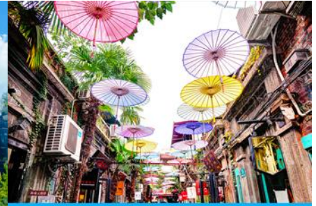
ย่านเกียบจิวฟา