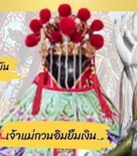
เจ้าแม่กวนอิมฮิมเงิน