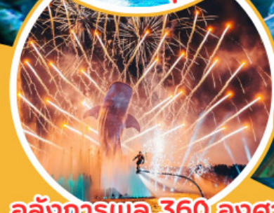
อลังการพลุ 360 องศา