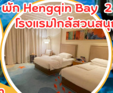
พัก Hengqin Bay 2 คืน!! โรงแรมใกล้สวนสนุก