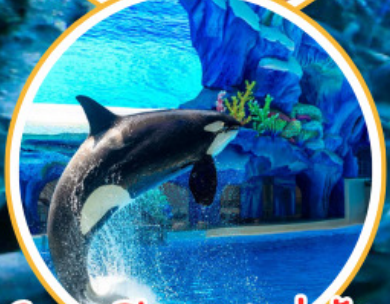
Orea Show สุดน่ารัก