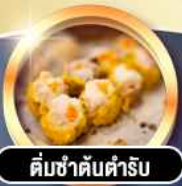
ต้มซ่าต้นตำรับ

гаринди! พิเศษ 4 ดาว THE KOWLOON HOTEL ติดถนนนาธาน ย่านช้อปปิ้งจิมซาจอย