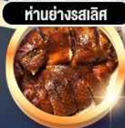
हांอย่างสลิส