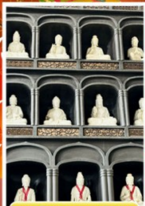
วัดไดชิซังเซโอดิจิ