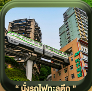
“ นั้งรถไฟทะลุตึก ”

บินตรงลงจงซิง • อุหลง หลุมฟ้าสะพานสวรรค์ • ระเบียบแก้ว • อุทยานเขานางฟ้า หงหยาดัง • นั้งรถไฟทะลุตึก • ศาลาประชาคม (ด้านนอก) • หลงหมินฮ่าว มรดกโลกผาหินแกะสลักต้าจู้ • วัดหลัวฮั่น • ตึกตะเกียบ • ถนนคนเดินเจียฟางเป่ย์