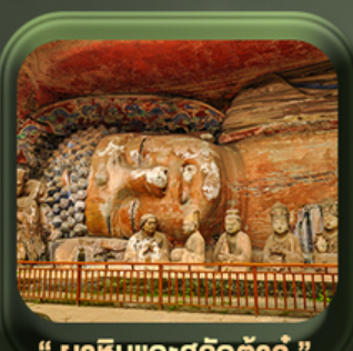
“ ผาหินแกะสลักต้าจู้ ”

วันเดินทาง มี.ค. - ต.ค. 2569 ราคาเริ่มต้น 22,999.-