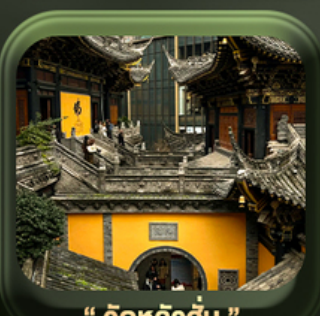
“ วัดหลัวฮั่น ”