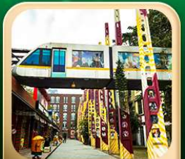
“ตงเจียวจี้”